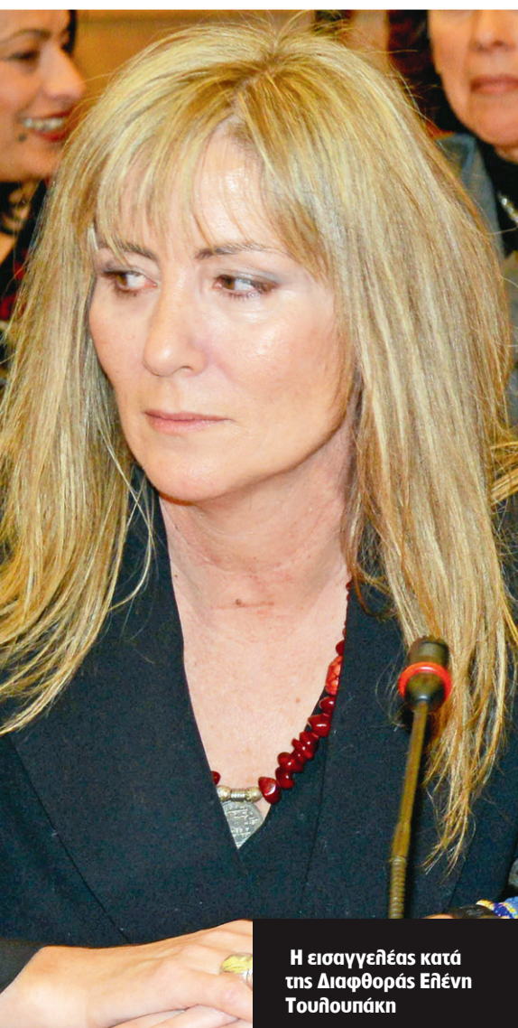
Η εισαγγελέας κατά της Διαφθοράς Ελένη Τουλουπάκη

το ενδιαφέρον που επέδειξε κάποια στιγμή για μια επιχείρηση στη Μεσσηνία. Αυτό προκύπτει από σχετικό προσύμφωνο που βρέθηκε στην κατοχή πρώην επικεφαλής ασφαλιστικού ταμείου κατά την έφοδο των εισαγγελιών στο σπίτι και το γραφείο του και ο οποίος κατονομάζεται από έναν εκ των προστατευόμενων μαρτύρων ως αποδέκτης «δώρου».