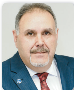
άρθρο του ΝΙΚΟΛΑΟΥ ΡΟΔΟΠΟΥΛΟΥ*

Σε αυτό το διάστημα, παρόλο που τους τελευταίους 45 μήνες -δηλαδή σχεδόν τέσσερα χρόνια- η ελληνική οικονομία βρισκόταν σε κατάσταση αποπληθωρισμού, οι τιμές σε βασικά