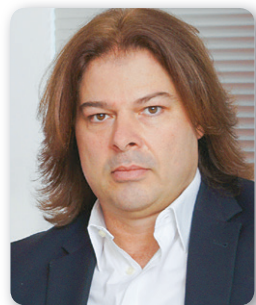
άρθρο του ΠΑΝΑΓΙΩΤΗ ΒΛΑΧΟΓΙΩΡΓΗ*

* Γενικός γραμματέας της Πανελληνίας Ενωσης Επιχειρήσεων Διαμεταφοράς