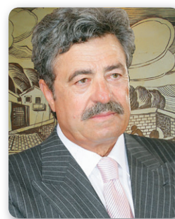
άρθρο του ΝΙΚΟΥ ΚΑΡΑΓΕΩΡΓΙΟΥ*

* Πρόεδρος του Ελληνικού Συνδέσμου Βιομηχανιών Επωνύμων Προϊόντων