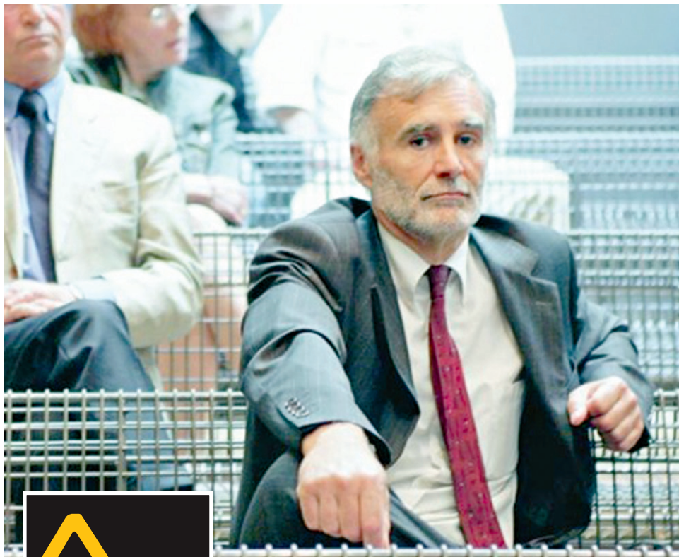
Ο ΠΡΩΗΝ πρόεδρος της Thales Μισιέλ Ζοσεράν, η κατάθεση του οποίου είχε «ξεχαστεί» από το 2005

Engineering Consulting, θυγατρικής της Thales International, κατηγορήθηκε για δωροδοκίες τοπικών παραγόντων για τη σύμβαση κατασκευής του τραμ της Νίκαιας. Μπροστά στις εισαγγελικές Αρχές, όμως, το στέλεχος δεν δίστασε να ισχυριστεί ότι οι δωροδοκίες ήταν μέρος της στρατηγικής της εταιρείας-κολοσσού, για να κερδίζει αναθέσεις έργων στη Γαλλία, αλλά και σε αρκετές άλλες χώρες, μεταξύ των οποίων και η Ελλάδα. Τον Σεπτέμβριο του 2005, η «Le Monde» κυκλοφορεί με συνέντευξη του Μ. Ζοσεράν, που επαναλαμβάνει όσα είπε στον εισαγγελέα. Ο τίτλος είναι σε εισαγωγικά: «Εκτιμώ ότι η Thales πρέπει να δίνει σε παράνομες προμήθειες μεταξύ 1% και 2% του τζίρου της», ισχυρίζεται ο Ζοσεράν, περιγράφοντας αναλυτικά το σύστημα προώθησης παράνομων χρημάτων της εταιρείας. «Στη Thales υπάρχει ένας νομικός εμπειρογνώμονας ικανός να παρακάμψει τον νόμο. Εθεσε σε εφαρμογή έναν ολόκληρο μηχανισμό για τον σκοπό αυτό. Το σύστημα ήταν οργανωμένο από μεσάζοντες των υπερβολών, που η βάση τους είναι στο εξωτερικό. Πολλαπλασιάζοντας τους μεσάζοντες, γίνεται δυσκολότερο να φθάσουμε ως τη Thales», δηλώνει στη «Le Monde».