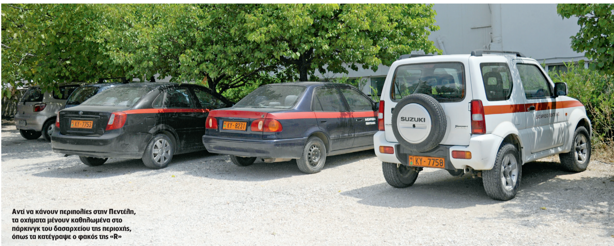
Αντί να κάνουν περιπολίες στην Πεντέλη, τα οχήματα μένουν καθηλωμένα στο πάρκινγκ του δασαρχείου της περιοχής, όπως τα κατέγραψε ο φακός της «R»