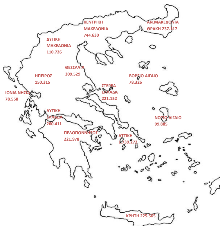
Χάρτης 1: Καταβολή Συντάξεων ανά Περιφέρεια

Στον Πίνακα 25 αποτυπώνονται τα ποσά σύνταξης που αντιστοιχούν σε κάθε Περιφέρεια σε σχέση με το αντίστοιχο ΑΕΠ για το έτος 2013 (προσωρινά στοιχεία ΕΛΣΤΑΤ). Σύμφωνα με τα δεδομένα του Πίνακα, στην Περιφέρεια Ηπείρου παρατηρείται η μεγαλύτερη τιμή (21,7%) του λόγου ποσού σύνταξης προς ΑΕΠ και ακολουθεί η Περιφέρεια Θεσσαλίας με τιμή 19,8%. Στην τελευταία θέση βρίσκεται η Περιφέρεια Νοτίου Αιγαίου με τιμή 10,2%.